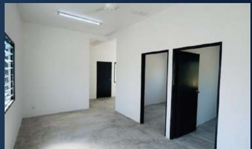
Reka bentuk dalam rumah