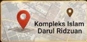
Kompleks Islam Darul Ridzuan